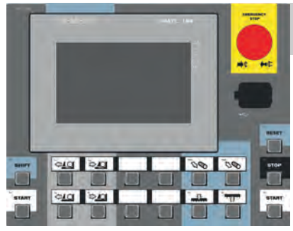
CONTROL PANEL: SIEMENS (X-CNC)