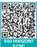
540 HORIZONT X-CNC